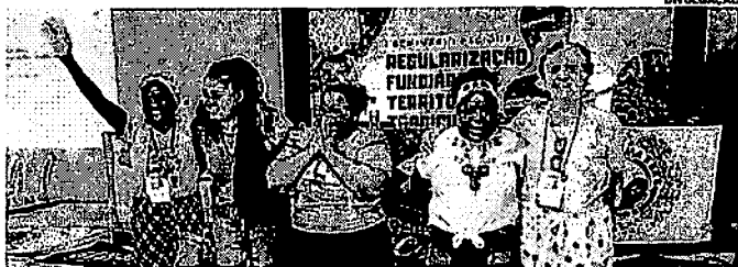
Quebradeiras de coco aprovadas no vestibular da Universidade Estadual do Maranhão

Durante o I Seminário Regional de Regularização Fundiária de Territórios Tradicionais-Nordeste, que aconteceu entre os dias 12 a 15 de agosto, na Universidade Federal do Maranhão (Ufma), o Movimento Interacadêmico das Quebradeiras de Coco Babaçu (MIQCB) apresentou as quebradeiras que foram aprovadas no vestibular da Universidade Estadual do Maranhão (Uema). As mulheres irão cursar Licenciatura do Campo, com Habilitação em Ciências Humanas para quebradeiras e agroextrativistas. A Licenciatura terá duração de quatro anos e as aulas serão na modalidade de formação por alternância, em São Luís. A conquista é fruto de articulação do MIQCB, por meio do Centro de Formação das Quebradeiras de Coco Babaçu, junto ao Programa de Formação Docente para atender a Diversidade Étnica do Maranhão (Proetnos/Uema). Foram selecionadas quatro quebradeiras da Regional Baixada: