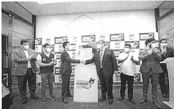
Governador Flávio Dino apontou a importância de que mais empresas invistam na região central da cidade

"A gente tá muito feliz em estar aqui, como o segundo casarão entregue dentro do programa Nosso Centro e o primeiro da área de tecnologia. O investimento que o governo do Estado está fazendo ajuda a direcionar as nossas atividades para cá e toda essa nova vitalidade que a gente está proporcionando aqui. Penso