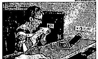
Não perca essa oportunidade única de impulsionar sua carreira

Se você é um profissional atento às tendências do mercado de trabalho, provavelmente já ouviu falar de lifelong learning. Mas, se esse termo ainda é novidade para você, vamos te apresentar tudo o que você precisa saber, além das principais vantagens de adotar esse conceito na sua carreira. Lifelong learning significa aprendizado contínuo ao longo da vida. Esse conceito envolve a busca constante por conhecimento, independentemente da área, transformando o aprendizado em um hábito. As competências adquiridas podem abranger desde soft skills (habilidades interpessoais) até hard skills (conhecimentos técnicos). A ideia central é nunca parar de aprender e usar esse conhecimento no dia a dia. A essa altura já fica bem claro como