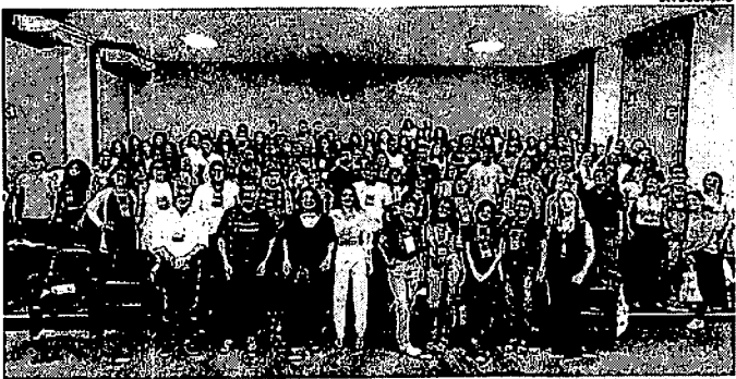
VII Seminário de Formação de Professores do Programa Ensinar da Uema