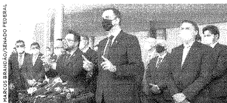
Rodrigo Pacheco destacou a criação do comitê e disse que a pandemia impõe o dever cívico e patriótico e de responsabilidade para a união dos Poderes e do povo

mas deve ser participado, até para que haja um controle prévio da constitucionalidade, sobre as medidas que serão tomadas desde já, como a participação da iniciativa privada, a ampliação de leitos de UTI, a solução dos problemas de oxigênio e de insumos de medicação e fundamentalmente a política do Ministério da Saúde para vacinação do povo brasileiro que exige a colaboração de todos os poderes e instituições da sociedade e da imprensa, para que possamos alargar a escala de vacinação no Brasil”, revelou. Para ele, a criação do comitê é “é um exemplo de cidadania, de boa relação e harmonia dos poderes em um momento em que a sociedade,