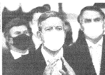
Arthur Lira defende despoliticização, ação coordenada e um discurso único de combate à pandemia da Covid-19

sub a supervisão do presidente da República e teremos um único discurso e uma única orientação nacional conduzido pelo ministério”, conclamou. Lira também destacou a atuação responsável da Câmara dos Deputados no combate ao novo coronavírus, com aprovação de propostas em benefício à população, de ajuda a setores diversos da economia e de socorro a estados e municípios. Lira sinalizou que os parlamentares devem votar um projeto de lei para ampliar o número de leitos no SUS em parceria com a iniciativa privada.