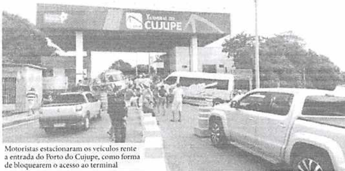
Motoristas estacionaram os veículos rente a entrada do Porto do Cujupe, como forma de bloquearem o acesso ao terminal

De acordo com a Cooperativa de Transporte Alternativo e Regular do Maranhão (Coopetram), a categoria de motoristas de vans e micro-ônibus é contra uma medida da empresa Servi-Porto – administrada pela Agência de Mobilidade Urbana e Serviços Públicos (MOB) – que anulou a reserva antecipada de passagens para viagens no ferry-boat. Na quarta-feira (19), a categoria realizou um protesto, que ocorreu no Porto do Cujupe, que é um terminal dos ferries, em Alcântara, que recebe embarcações vindas do terminal da Ponta da Espera, em São Luís, e vice-versa.